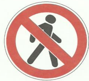
«Движение пешеходов запрещено»