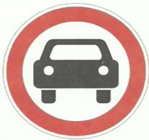
«Движение механических транспортных средств запрещено»