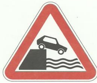
«Выезд на набережную»