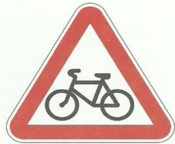
«Пересечение с велосипедной дорожкой»