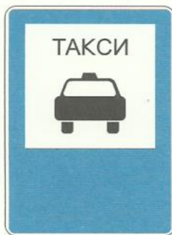
«Место стоянки легковых такси»