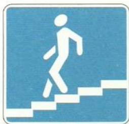
«Подземный пешеходный переход»