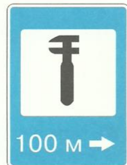
«Техническое обслуживание автомобилей»