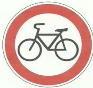
«Движение на велосипедах запрещено»