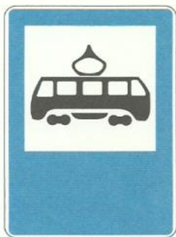
«Место остановки трамвая»