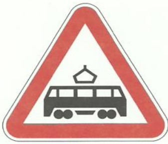
«Пересечение с трамвайной линией»