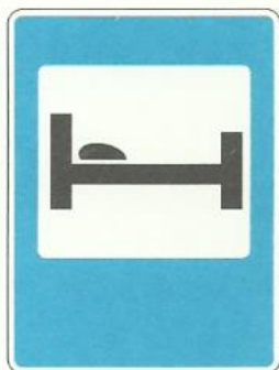
«Гостиница или мотель»