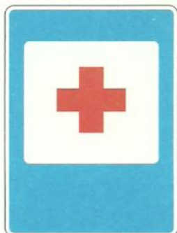
«Пункт первой медицинской помощи»